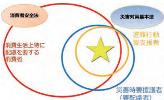
図-1 「要配慮者」、「避難行動要支援者」及び「消費生活上特に配慮を要する消費者」の関係性についての一考察

改正災害対策基本法と改正消費者安全法は、期せずして、ほぼ同時期に、同一の支援対象者に対して効力を発揮する法案になったと評価できると考える。